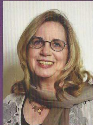
Projektleitung und Koordination : Renate Weber

Nähere Informationen erhalten Sie auf unserer Homepage, telefonisch oder nach Voranmeldung auch persönlich bei einem unserer monatlichen Gruppentreffen.